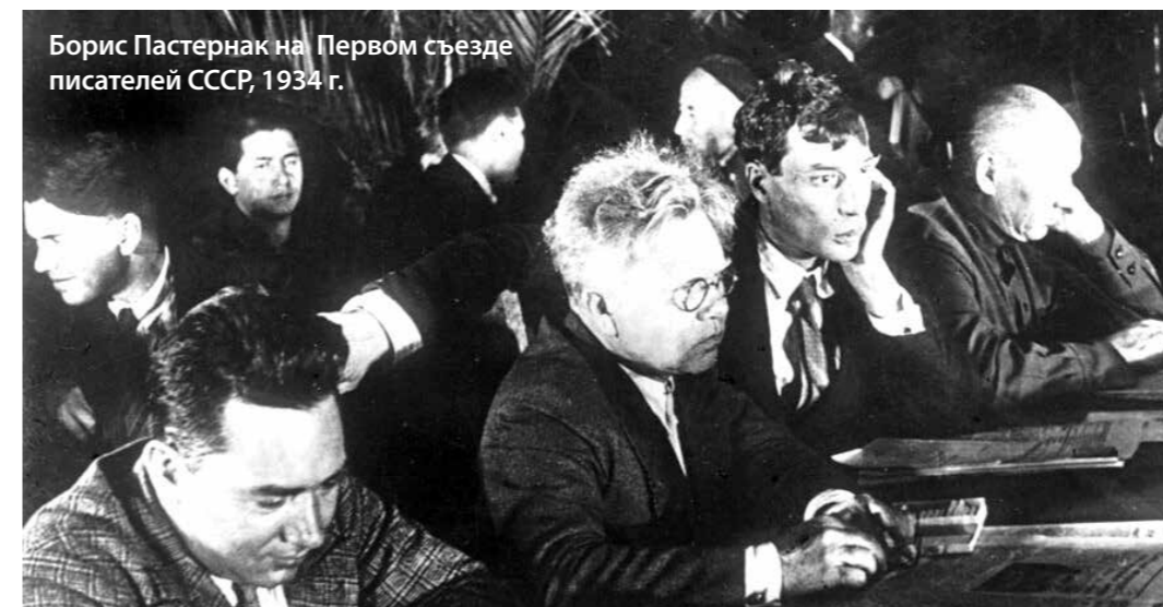
Борис Пастернак на Первом съезде писателей СССР, 1934 г.

В день присуждения премии Президиум ЦК КПСС принял постановление «О клеветническом романе Б. Пастернака», которое объявило решение Нобелевского комитета очередной попыткой втягивания в холодную войну. В официальной писательской среде Нобелевская премия Пастернаку была воспринята также крайне негативно. Союз писателей СССР исключил Пастернака из своих рядов, предлагал лишить его гражданства и выслать из страны.