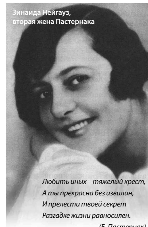
Зинаида Нейгауз, вторая жена Пастернака

Письмо Б. Пастернака содержало такие строки: «У меня никогда не было намерений принести вред своему государству и своему народу».